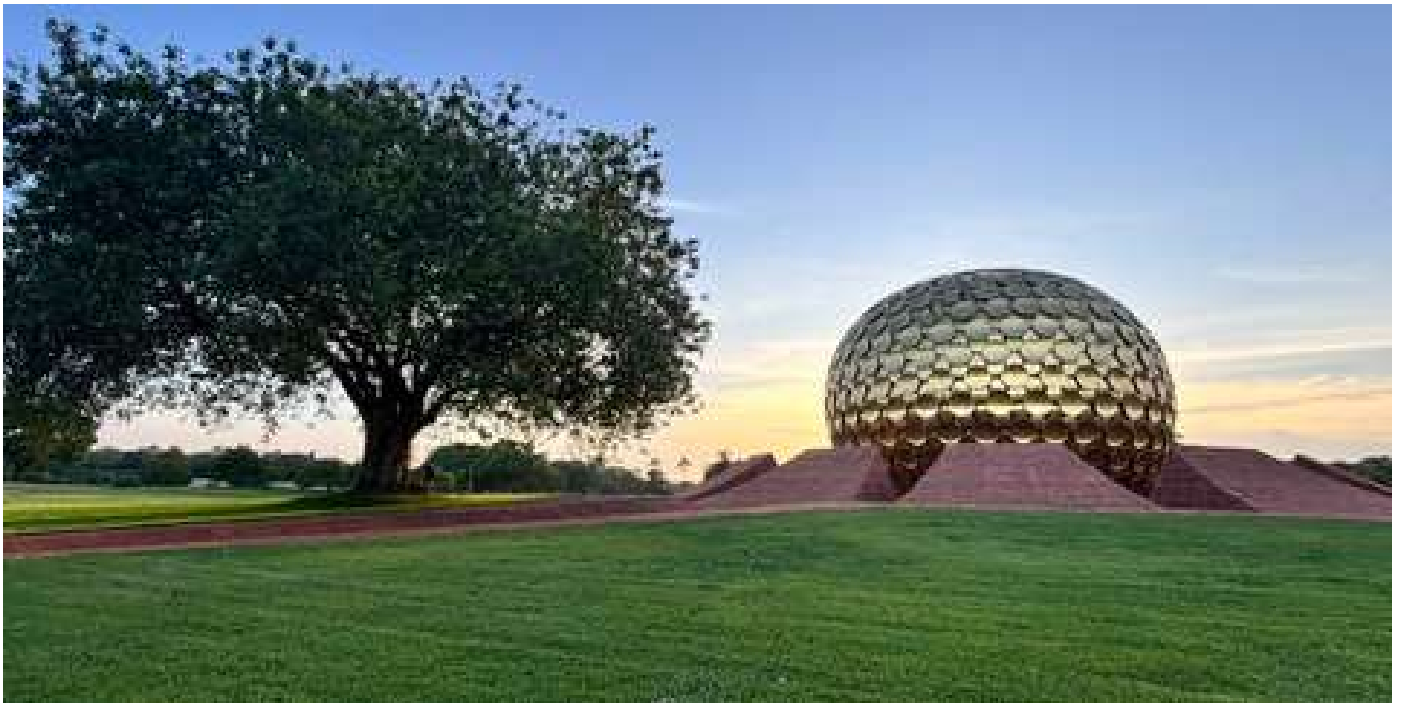
▲Auroville曙光村的中心，金球聖母殿(Matri mandir)

這將不僅是心靈的饗宴，同時在居住環境，三餐的安排，都將邀請你感受到大自然的豐盛與照顧。邀請你身心靈都放鬆自在。