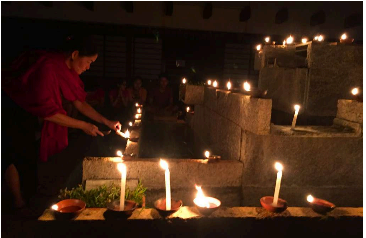
▲為地球點燈祈福儀式