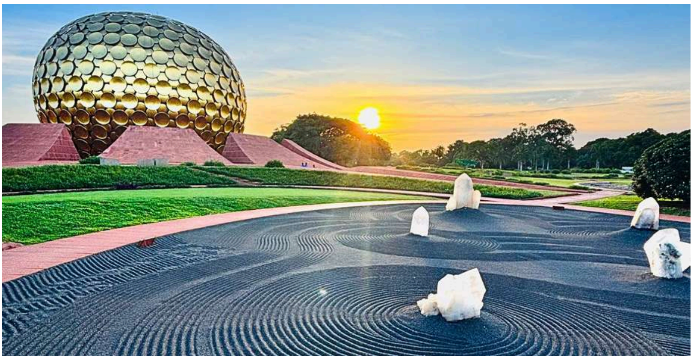
▲Matri mandir 水晶花園