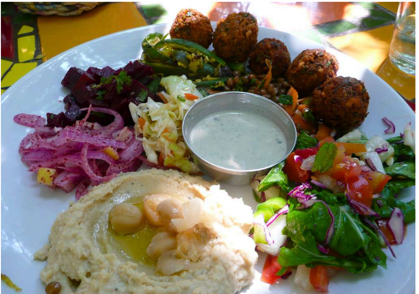
▲滋養身心的蔬食料理