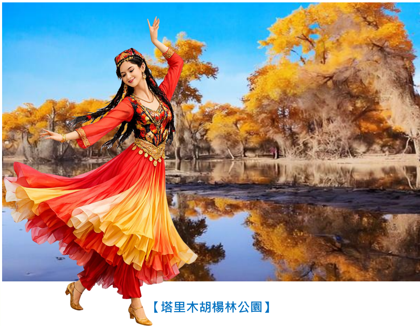
【塔里木胡楊林公園】

集塔河自然景觀、胡楊景觀、沙漠景觀為一體，是世界上古老、面積大、保存完整而又原始的胡楊林保護區。景區中，一條古老的道路——“絲綢之路”在胡楊林中穿行。