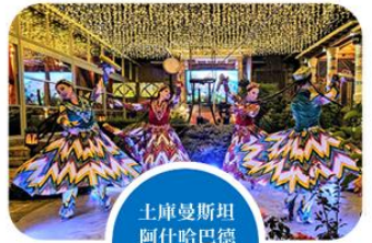
土庫曼斯坦 阿什哈巴德 傳統舞蹈表演