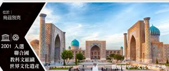
撒馬爾罕 | 文化交匯之地