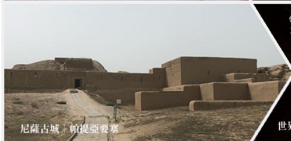
尼薩古城 | 帕提亞要塞