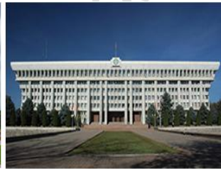
白宮 White House