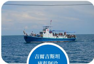
吉爾吉斯坦 庫彭阿洽 伊塞克湖遊船