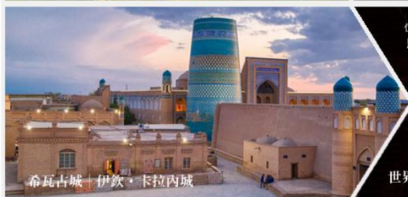
希瓦古城 | 伊欽·卡拉內城