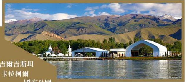
吉爾吉斯坦 卡拉柯爾 國家公園