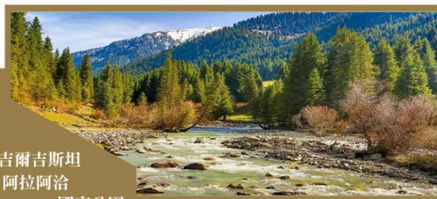
吉爾吉斯斯坦 阿拉阿圖 國家公園