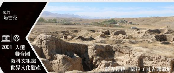
彭吉肯特 | 薩拉子目古城遺址