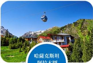
哈薩克斯坦 阿拉木圖 觀光纜車