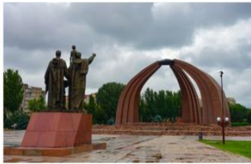
勝利廣場 Victory Square