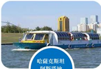
哈薩克斯坦 阿斯塔納 阿姆河遊船