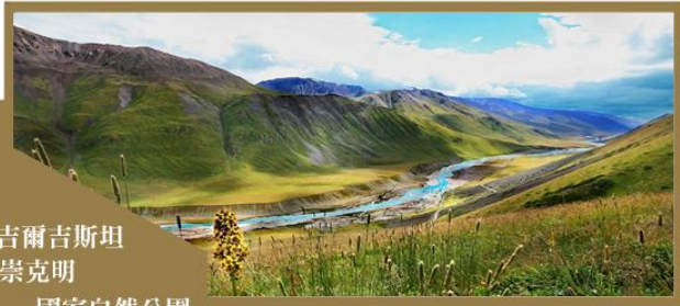
吉爾吉斯坦 崇克明 國家自然公園