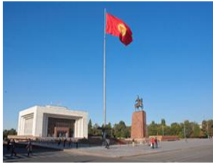
阿拉土廣場 Central Square Ala-Too

比什凱克市區觀光：阿拉土廣場、白宮、中央清真寺、橡樹公園、安排觀賞傳統音樂表演 今日回至比什凱克之後，前往參觀該市最主要的軸線，首先「阿拉圖廣場」Central Square Ala-Too，是 984 年時為了慶祝吉爾吉斯共和國 60 週年所建，是該市的主要公共廣場與政治象徵。它是該國最重要的城市地標之一，常被用作國家慶典、抗議活動與文化活動的核心場地。之後經過「橡樹公園」來到「勝利廣場」，這裡主要用來紀念在第二次世界大戰中犧牲的士兵與人民。廣場上最醒目的是一座象徵傳統氈房骨架的拱形紀念碑與中央的永恆火焰。【白宮】White House，是吉爾吉斯斯坦總統的官邸。曾經是 2005 年鬱金香革命和 2010 年吉爾吉斯斯坦革命發生地，見證多次政治轉折。最後【中央清真寺】Central Mosque，潔白圓頂與藍色裝飾融合土耳其與中亞風格，象徵伊斯蘭在現代吉爾吉斯社會的精神地位。從紀念廣場到清真寺，比什凱克展現出政治記憶、宗教信仰與日常生活並存的城市層次。