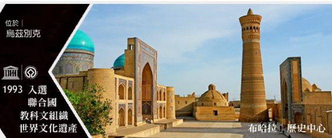
布哈拉 | 歷史中心