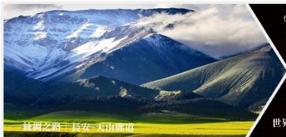
絲綢之路 | 長安-天山廊道