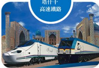
烏茲別克斯坦 塔什干 高速鐵路