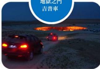
土庫曼斯坦 地獄之門 吉普車