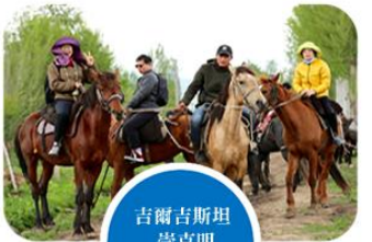
吉爾吉斯坦 崇克明 草原騎馬