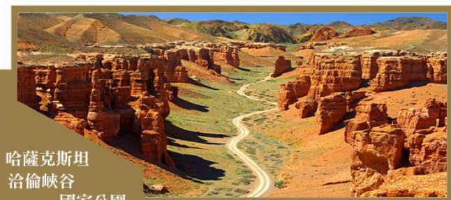
哈薩克斯坦 恰倫峽谷 國家公園