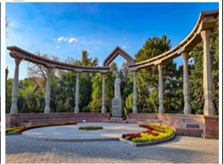
橡樹公園 Oak Park