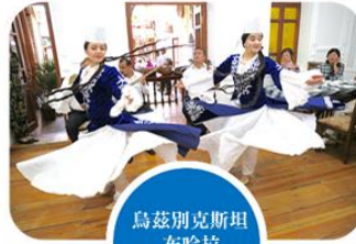
烏茲別克斯坦 布哈拉 傳統舞蹈表演