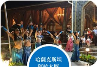
哈薩克斯坦 阿拉木圖 舞蹈表演