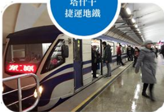
烏茲別克斯坦 塔什干 捷運地鐵