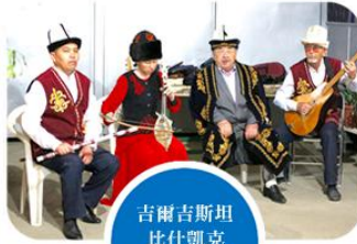
吉爾吉斯坦 比什凱克 傳統樂器表演